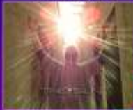
Spectacle The sun