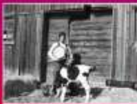
Spectacle Folk agricole de Yan Boissonneault